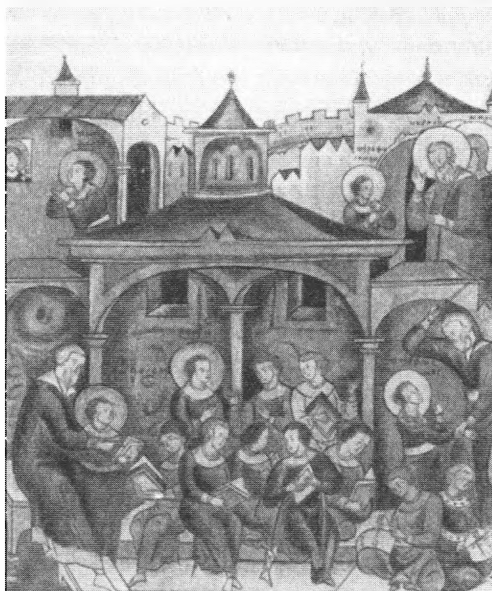
Древнерусская школа Миниатюра из Жития Сергия Радонежского . XVI в.

нормы выплат за освящение церкви в пользу епархии, причем отныне запрещено самостоятельно, без разрешения светских и церковных властей, строить новые храмы.